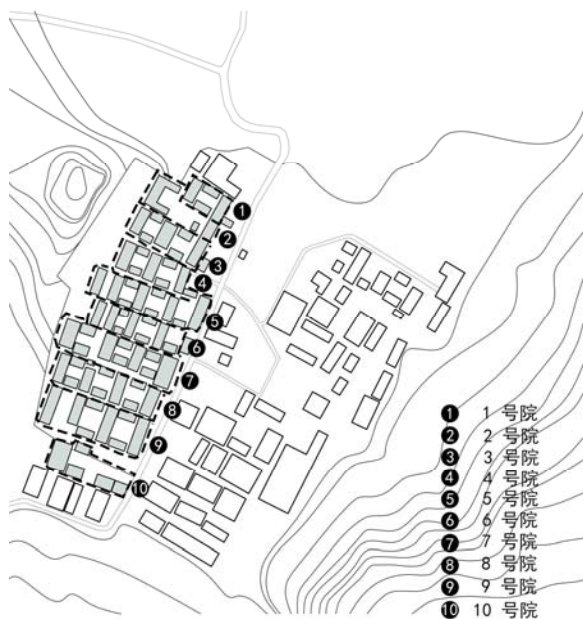
图2 小店河村整体格局。

小店河村于清乾隆十三年初成定局, 虽部分建筑受损, 但整体格局依旧特色鲜明, 具有一定的历史价值。保存较为完整的建筑有十座, 共二十八进四合院, 七十八座房屋。寨门保存完整, 部分寨墙、街巷及标志建筑的布局遗存状况良好。其中, 十处院落自南向北呈一字型坐落于龟形高坡之上, 单个院落坐西向东, 自大门至正房, 依附高坡逐级抬升, 场地内建筑呈现了极强的统一性与韵律感(图2)。